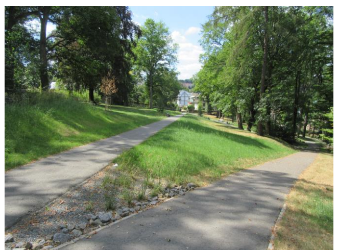
Parkwege aus Asphaltbelag