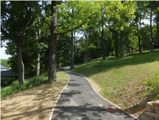
unterer Abschnitt des Verbindungsweges Nicolaistraße – Lamnitzer Straße