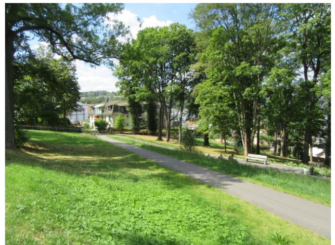
Parkwege aus Asphaltbelag, Parkmöblierung