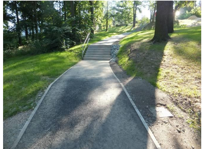
Verbindungsweg im oberen Parkbereich mit Treppenanlage 5