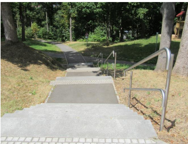
Zugangsbereich zum Stadtpark an der Lamnitzer Straße, am oberen Ende des Verbindungsweges