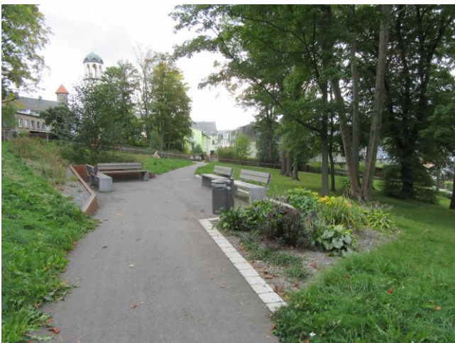
Aufenthaltsbereich mit extensiver Gräser-/Staudenpflanzung