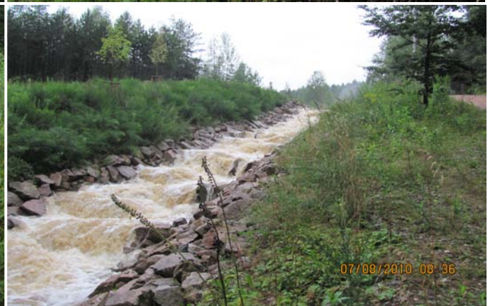
Gewässerprofil bei HW - Abfluss / rechts Weidenspreitlage 2.EW